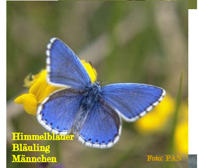
Himmelblauer Bläuling Männchen