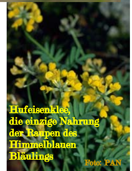
Hufeisenklee, die einzige Nahrung der Raupen des Himmelblauen Bläulings