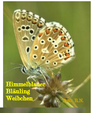
Himmelblauer Bläuling Weibchen

Darunter befinden sich auch gefährdete oder rückläufige Arten.