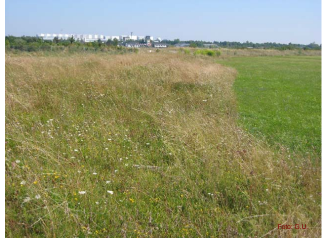
Anwacherfolg auf der ersten Versuchsfläche der Mähgutübertragung

Der Rodelberg wurde mit einer speziell ausgewählten Samenmischung begrünt. Die Samen stammen ausschließlich aus dem Naturraum der Münchner Schotterebene, Florenverfälschung ist somit ausgeschlossen. Zur Ernte der Samen werden spezielle landwirtschaftliche Maschinen eingesetzt. Auch die West-Wiesenscholle wird mit dieser Samenmischung begrünt werden.