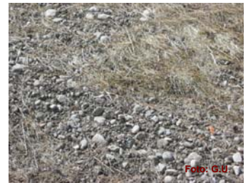
angewalztes Mähgut auf Südscholle