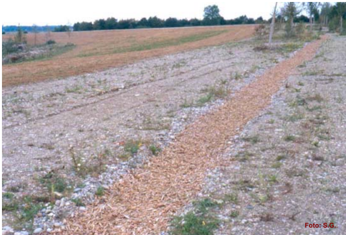
Südscholle mit ausgebrachtem Mähgut, sowie neu angelegter Trampelpfad mit Rindenmulch.

Der Rodelberg wurde mit einer speziell ausgewählten Samenmischung begrünt. Die Samen stammen ausschließlich aus dem Naturraum der Münchner Schotterebene, Florenverfälschung ist somit ausgeschlossen. Zur Ernte der Samen werden spezielle landwirtschaftliche Maschinen eingesetzt. Auch die West-Wiesenscholle wird mit dieser Samenmischung begrünt werden.